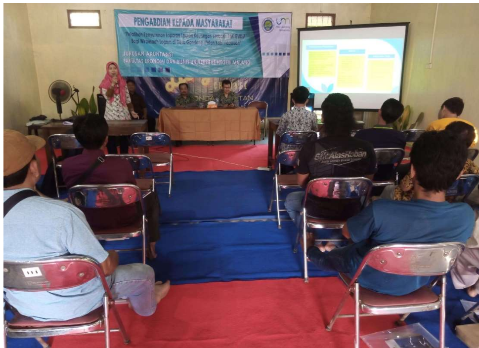
Gambar Pelatihan pada Tgl 24 Juni 2023 Penyusunan Laporan Keuangan Berbasis SAK EMKM

e-ISSN 2807-5633 // Vol.3 No.6 December 2023