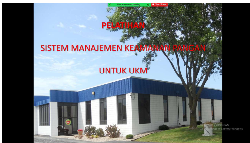
Gambar 1. Tampilan Pelatihan Online

Pelatihan sistem manajemen keamanan pangan FSSC 22000 kepada pengelola UKM ini sudah berjalan sesuai dengan jadwal yang ditetapkan. Pemateri yang cukup berpengalaman di bidang sistem manajemen keamanan pangan FSSC 22000 ini mampu menjelaskan secara jelas dan menarik antusiasme peserta, hal ini terlihat pada respon peserta pada sesi tanya jawab di mana peserta lebih banyak bertanya terkait aktivitas pekerjaan, masalah yang dihadapi di area kerjanya hingga kendala yang ditemui bila sistem manajemen keamanan pangan FSSC 22000 dijalankan secara konsisten di area lingkup kerjanya. Antusiasme terlihat juga saat pemateri memberikan pertanyaan-pertanyaan terkait materi yang sedang disampaikan, peserta mampu menjawab pertanyaan dengan jelas. Dengan modul yang sudah diberikan kepada setiap peserta mampu mendorong peserta untuk mempelajari Kembali dari materi yang disampaikan pemateri.