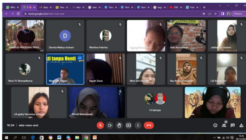
Gambar 2 : Partisipan zoom meeting

Kegiatan penyuluhan ini dengan tema “Penggunaan system Scan Barcode pada warung sembako” sebagai upaya guna meningkatkan efisiensi dan efektivitas layanan pembayaran non tunai di sektor Retail, agar dapat bertransaksi dengan aman. Kegiatan penyuluhan ini dilaksanakan pada tanggal 20 Desember 2022 yang dimulai pukul 10:30 Wib sampai dengan pukul 12:00 Wib.