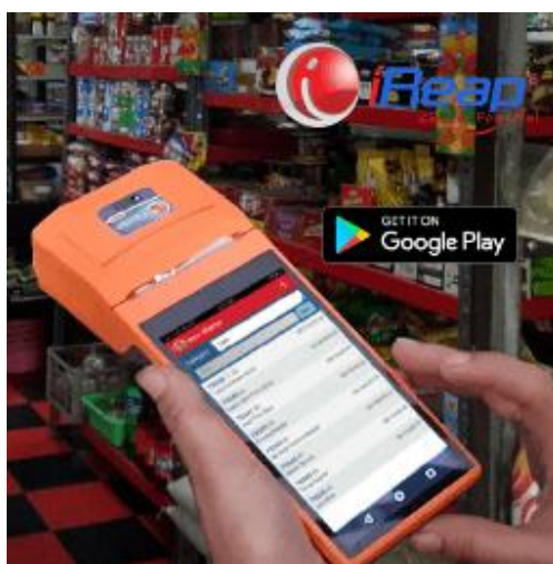
Gambar 1 : Aplikasi Scan Barcode